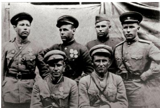
Группа партизан бригады им. Данукалова

Но сам себе не изменил, Других в бою спасать стремился. Доныне бог меня хранил, А тут, возможно, не решился.